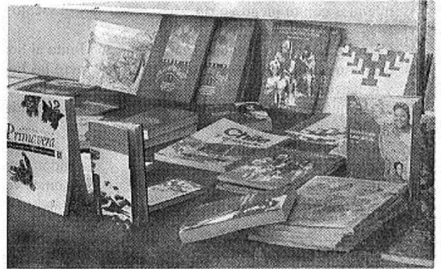
Algunos textos fueron exhibidos durante el acto.

El programa contempla intervenir en 642 comunidades indígenas, de las más de cuatro mil que hay en el país. «Es una apuesta del gobierno para instalar una metodología de trabajo del aparato público con las comunidades, para fortalecer sus cultura y rescatarla. Estamos conven-