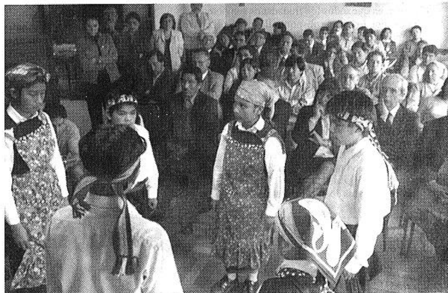
Alumnos de la escuela de Callaqui presentaron una danza intercultural.

cidos de que en el mundo globalizado de hoy la diversidad cultural y la pluralidad idiomática de un país es una ventaja y no una desventaja como pudo haber sido en el siglo pasado. Entonces, el gobierno del Presidente Lagos, dentro de las 16 medidas hacia los pueblos originarios, tiene este compromiso, que es también de todo Chile», dijo Pistacchio.