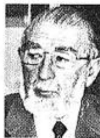
Mariano Ruiz Esquide.

• Senador Mariano Ruiz Esquide, el más optimista, piensa que no habrá problemas en la comisión mixta, y luego en las salas, para aprobar el proyecto que rechazó el Senado porque faltó un voto para el quórum mínimo.