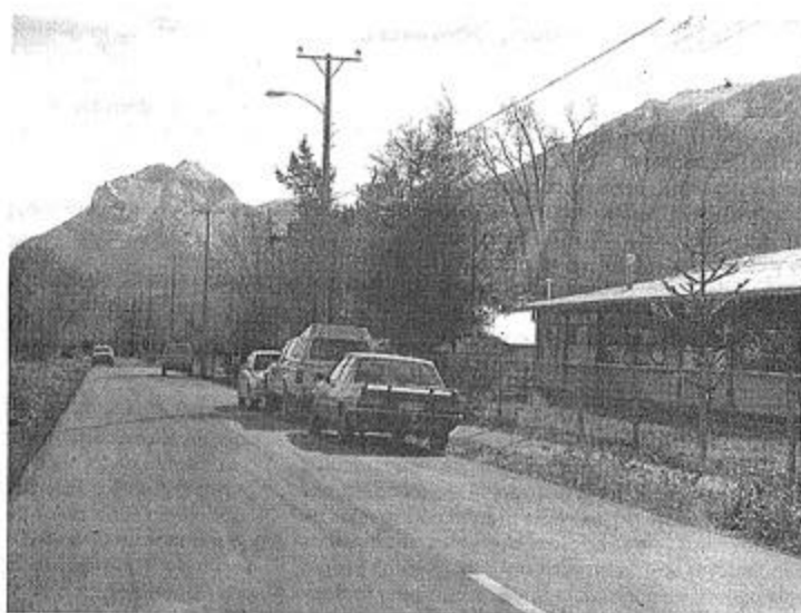
La majestuosa cordillera circunda la villa de Ralco. La foto muestra parte del liceo internado de Ralco.